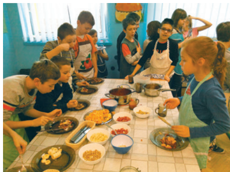
Kulinarne popisy uczniów.