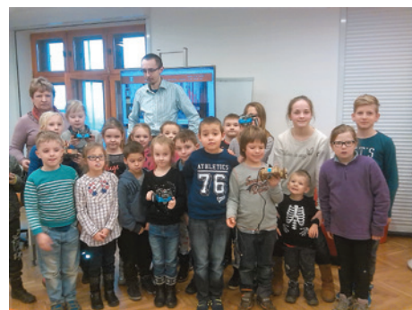
Jednym z punktów była wizyta w bibliotece.