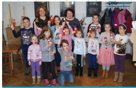
Warsztaty rękodzieła w COK.

niejszych materiałów ulubionego Muminka, przygotować dioramę przedstawiającą dolinę Muminków, zrobić ekologiczną muminkową torbę, techniką decoupage'u wyczarować