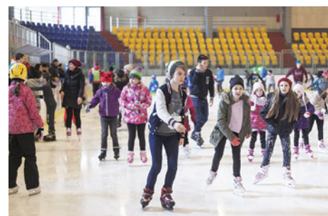
Wiele działo się na tafli lodowiska.