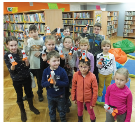
Zabawa była przednia.

Wyjątkowym projektem realizowanym w bibliotece podczas ferii był także cykl warsztatów filmowych Animki bez granic . Mali miłośnicy X muzy wspólnie tworzyli scenariusz, ilustrowali tekst, a w końcu ani-