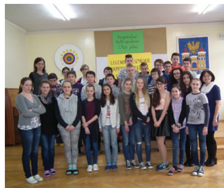
Przyjaźń ponad granicami kwitnie.

Opiekun Koła Naukowego „DI@jutra” – SP 2 Cieszyn