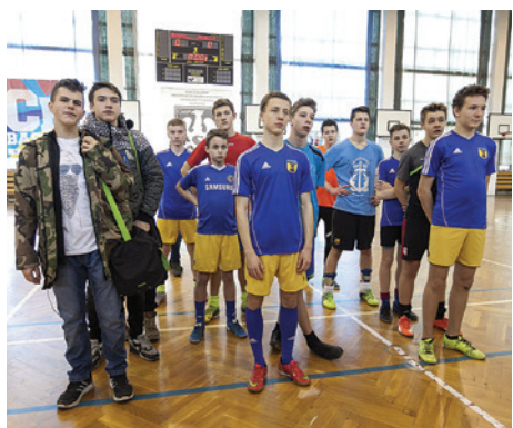
Turniej piłkarski „GOL!”.

Za nami ferie zimowe. Każdy kto spędził je aktywnie, na pewno się nie nudził. Wszystko to za sprawą szerokiej oferty aktywnego wypoczynku, jaką dla dzieci i młodzieży przygotowali organizatorzy z Cieszyńskiego Ośrodka Sportu i Rekreacji.