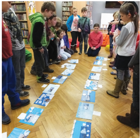
Zajęcia były bardzo zróżnicowane.

W czasie tegorocznych ferii za oknem, co prawda, czuć było wiosnę, ale w oddziale dla dzieci Biblioteki Miejskiej w Cieszynie panowała śnieżna i groźna zima. Zwyczajnie białych niedźwiedzi, wędrowni pingwinów, spotkanie z eskimosem i wyprawy Marka