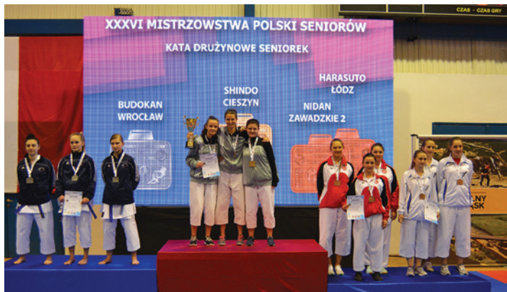
Taki widok chcielibyśmy oglądać jak najczęściej.