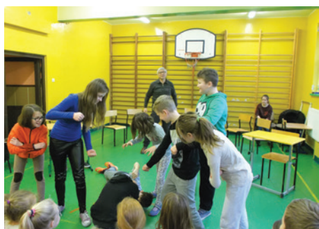
Zajęcia podczas ferii były zróżnicowane.