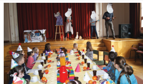
Zabawę zakończyło „Przyjęcie u Muminków”.