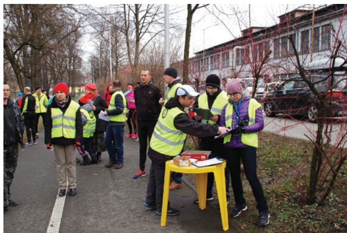
Sobotnie bieganie wzdłuż Olzy cieszy się coraz większą popularnością.

Każdego tygodnia w sobotę o 9.00 można pokonać wspólnie z grupą kilkudziesięciu zapaleńców dystans 5 km, a później przeglądając na stronie internetowej swoje wyniki oraz statystyki, niezależnie od tego, czy jest się biegaczem od kilku lat, czy też pokonało się trasę po raz pierwszy marszobiegiem.