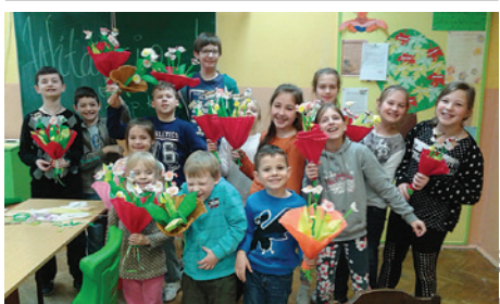
Podczas ferii w SP3 nikt się nie nudził.

W Szkole Podstawowej nr 3 z Oddziałami Integracyjnymi w Cieszynie podczas pierwszego tygodnia ferii zimowych odbyły się trzy rodzaje zajęć. Zajęcia kulinarne pt. W kuchni smaków dzieciaków , zajęcia ruchowe pt. Zabawy na sali i przy stole oraz zajęcia artystyczne pt. Twórcze zabawy, czyli coś z niczego . Z oferty skorzystało 60 dziewcząt i chłopców w wieku od 6 do